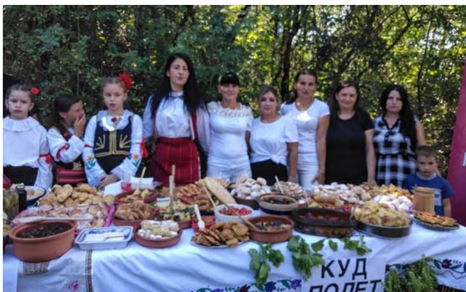
Штанд здраве хране КУД „Полет“ из Падежа