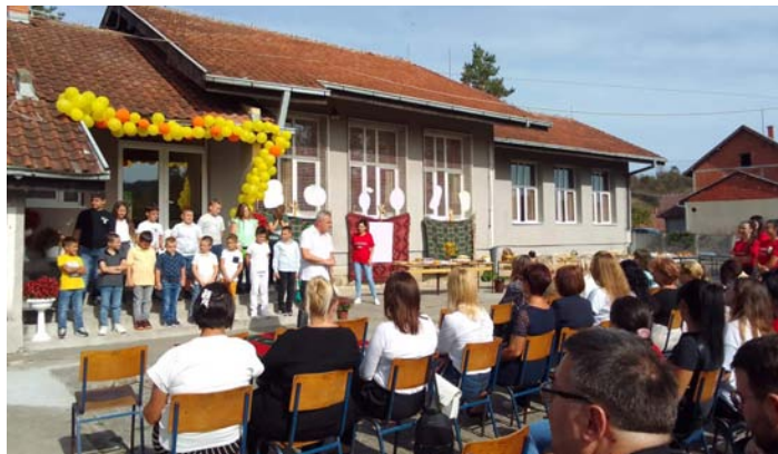
Директор на отварању програма