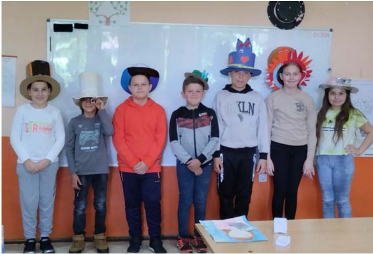
„Луде шеширџије“, Вратаре

Обележавање важних празника одлична је прилика за подстицање маште и прављење честитки: Нова година, Осми март, Ускрс... Радови ученика из Вратара.