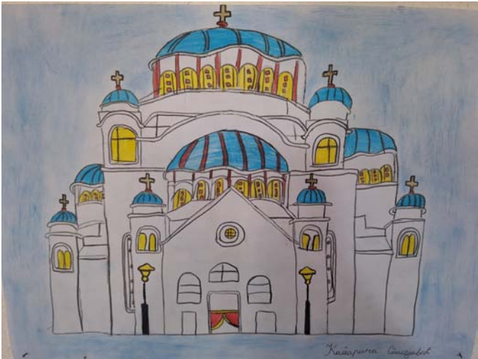
Катарина Спасојевић, 4. разред, Шашиловац

„Креативност је интелигенција која се забавља.“ Алберт Ајнштајн