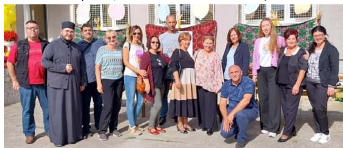
Део школског колектива