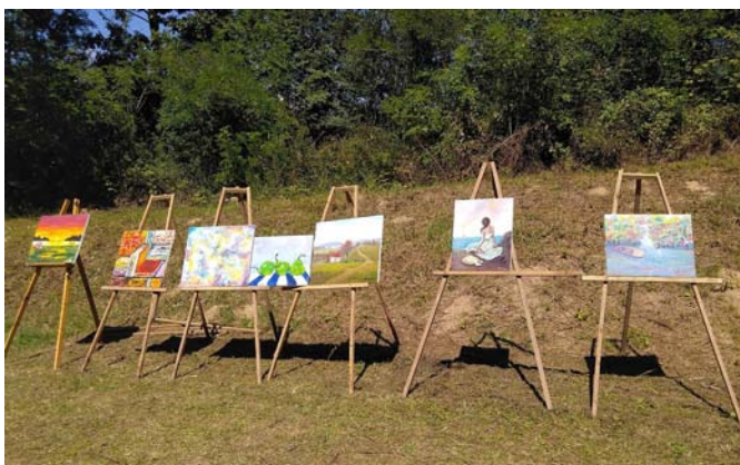
Изложба слика са колоније