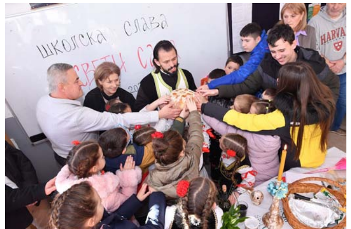
Сечење колача у Падежу

Традиционално се Савиндан обележава и у нашем одељењу у Крвавици. Ђаци и полазници вртића, у сарадњи са Културно-уметничким друштвом „Чарапанка“, извели су приредбу за родитеље и мештане Крвавице у сеоском Дому културе. Малишани у живописним костимима, уз рецитације, драмске текстове и музику упознали су публику са животом и делом Светог Саве. Сви ученици добили су од сеоског колачара пригодне пакетиће.