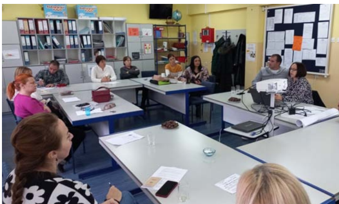
Наше гостовање у школи у Читлуку

Наш пројектни тим посетио је и ОШ „Свети Сава” у Читлуку и представио им свој први Еразмус+ пројекат. Надам се да смо их бар мало охрабрили да се упусте у ову авантуру, јер су добробити вишеструке и не односе се само на професионални, већ и на лични развој и усавршавање.