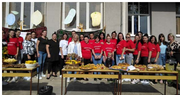
Вредне, веште и сложене домаћице