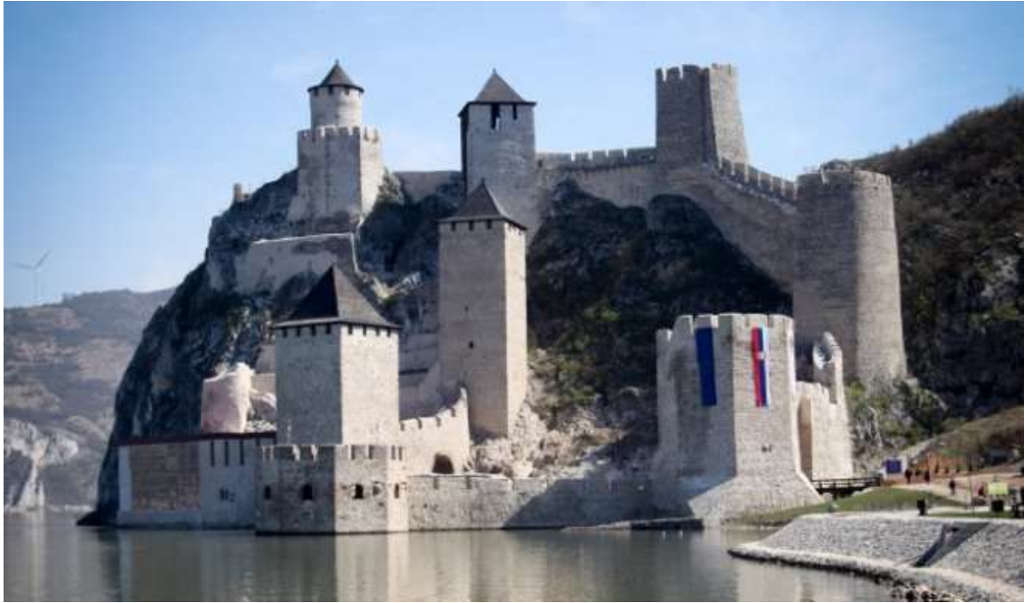
Средњовековна тврђава Голубац