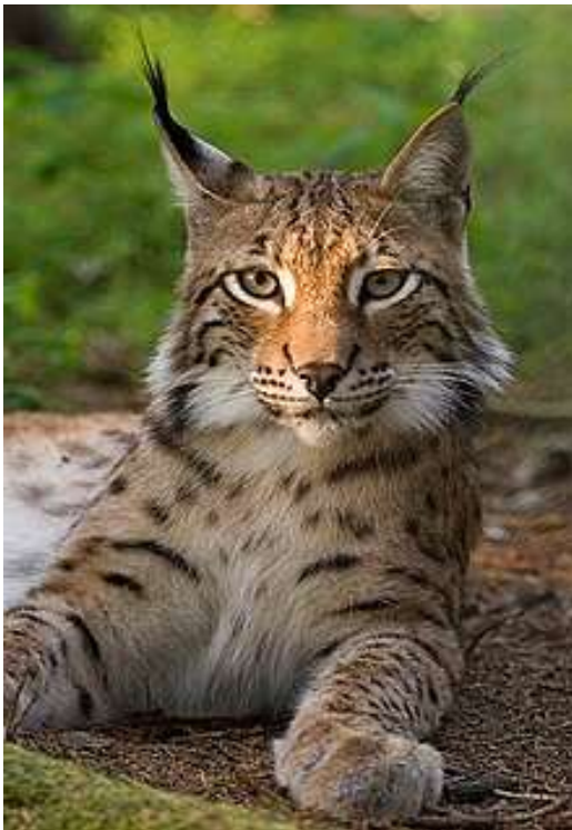
Рис је дивља мачка. Он је месојед. Лови мале и средње срне или дивокозе али некад напада и млађе јединке већих врста попут обличног јелена. Ређе лови мањи плен.

Пројектни рад на часовима дигиталног света ученика 4. разреда из Кривице